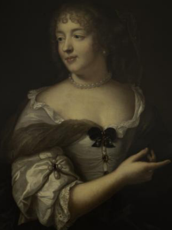
Marie de Rabutin-Chantal, marquise de Sévigné (1626-1696) Attribué à Claude Lefèvre (1632-1675)