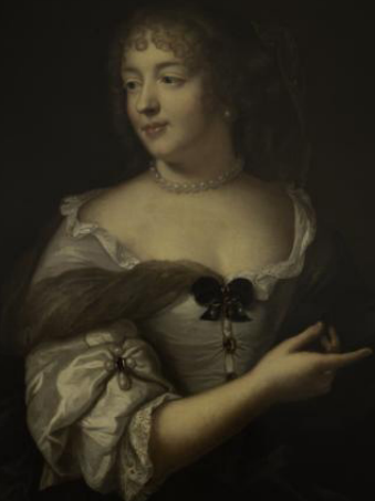
Marie de Rabutin-Chantal, marquise de Sévigné (1626-1696) Attribué à Claude Lefebvre (1632-1675)